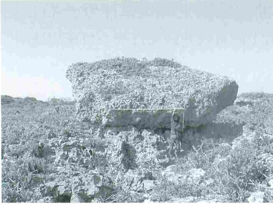
写真1 沖縄島南部の荒崎における琉球石灰岩の岩塊で、通称「カサカンジャー」と呼ばれている。歴史書の『球陽』に記載されている1832年の台風の高波によって近くの海食崖が剥離され、約35m移動して海拔約10mの台地に打ち上げられたと推測される。人物の上方にある水平のポールは3m、人物の右側にある垂直のポールは1mを示す。