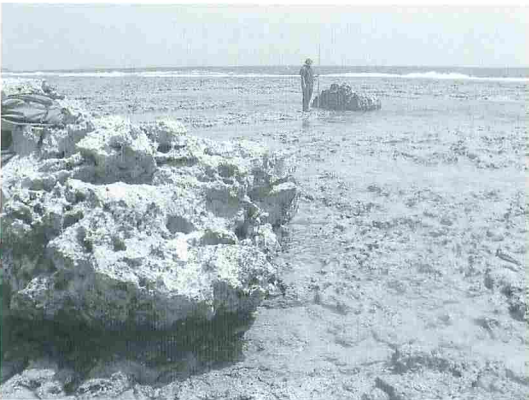
写真5 喜屋武の南岸にある2つのサンゴ礁岩塊。ルース台風の高波によって打ち上げられた。元来は1つの岩であったが、その後2つに細分された。