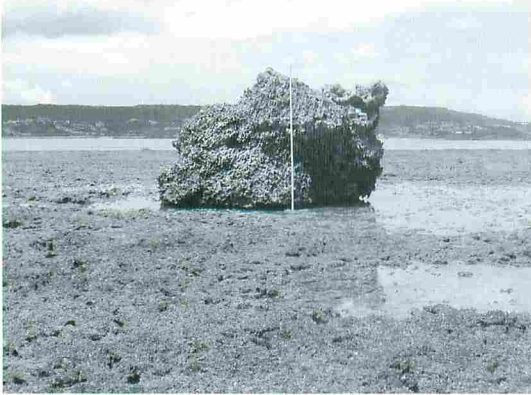
写真7 南城市知念沖の礁嶺上にあるサンゴ礁岩塊。通称「ユイサー石」と呼ばれている(写真6と同様の岩)。垂直のポールの長さは3mを示す。沖側から内陸側を臨む。写真のはるか後方の海岸と写真の礁嶺との間には広い礁池が発達している。