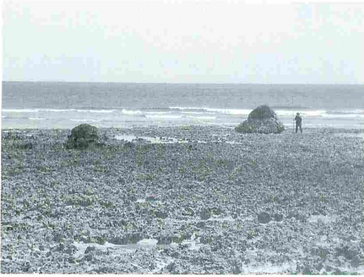
写真4 喜屋武の南岸にある2つのサンゴ礁岩塊。ルース台風の高波によって打ち上げられた。写真右の岩塊は、その後2007年7月に沖縄島に接近した台風4号の高波によって約2m移動した。