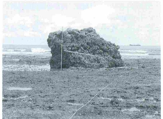
写真6 南城市知念沖の礁嶺上にあるサンゴ礁岩塊。通称「ユイサー石」と呼ばれている。縦と横のポールの長さは、いずれも3mを示す。1951年のルース台風の高波によって、写真後方の海面下に発達する礁斜面の一部が剥離されて現地点の礁嶺上に打ち上げられたと推測される(撮影：河名俊男)。

48' 52'' に位置しており、斜め下方に反転して礁嶺上に乗っている(従って、岩塊を構成するサンゴ化石群の最新部の箇所は、岩塊の斜め下方に位置する)。ユイサー石の礁嶺上での高度(潮位)は、当日の那覇港での実測値を、調査地域に最も近い地点(奥武島)での潮位に換算し、奥武島で