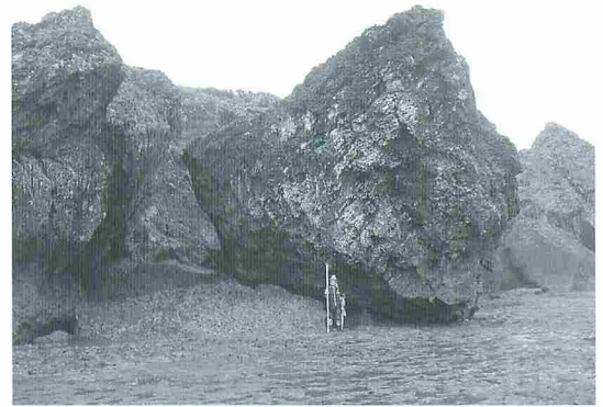
写真3 具志川城跡における海食崖下の琉球石灰岩の岩塊。1951年のルース台風以前は写真中央に、ほぼ垂直に位置していたが、ルース台風の高波によって写真の右側に傾いた（撮影：河名俊男）。

（ルース台風）が沖縄島と宮古島の間を通過し、924 hPa（10月13日）、929 hPa（10月14日）の気圧を記録した。ルース台風は10月13日には猛烈な台風へ成長して宮古島の東方海上を北上し、翌14日の03:40～04:45にかけて沖縄島西方の久米島を通過した。沖縄島では14日の午前2時頃から午前6時頃まで猛烈な暴風雨になった。とくに沖縄島南部とその西方の周辺島（慶良間諸島の渡嘉敷島や座間味島など）では、台風の接近時と満潮時が重なったため高潮が発生し、沖縄島南部海岸では最高10mの波高を有する高波が襲来した。ルース台風の接近により、沖縄島や周辺島では暴風被害に高潮災害が加わり、同地方は近年の台風災害史上、類をみない甚大な被害を被った（沖縄県、1977）。