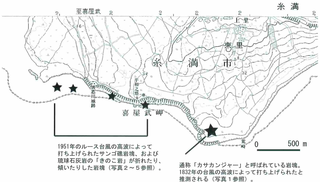
図1 沖縄島南部の喜屋武岬周辺域に点在するサンゴ礁岩塊および琉球石灰岩の岩塊。各岩塊については本文参照。 地形図は国土地理院発行の『数値地図25000 沖縄』の中の「喜屋武岬」図幅に基づく。