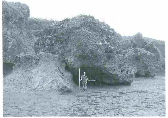
写真2 喜屋武岬（平和之塔）における海食崖下の琉球石灰岩の岩塊。元来、一続きの「きのこ岩」が、1951年のルース台風の高波によって、岩の上半部が写真後方に折れた（撮影：河名俊男）。