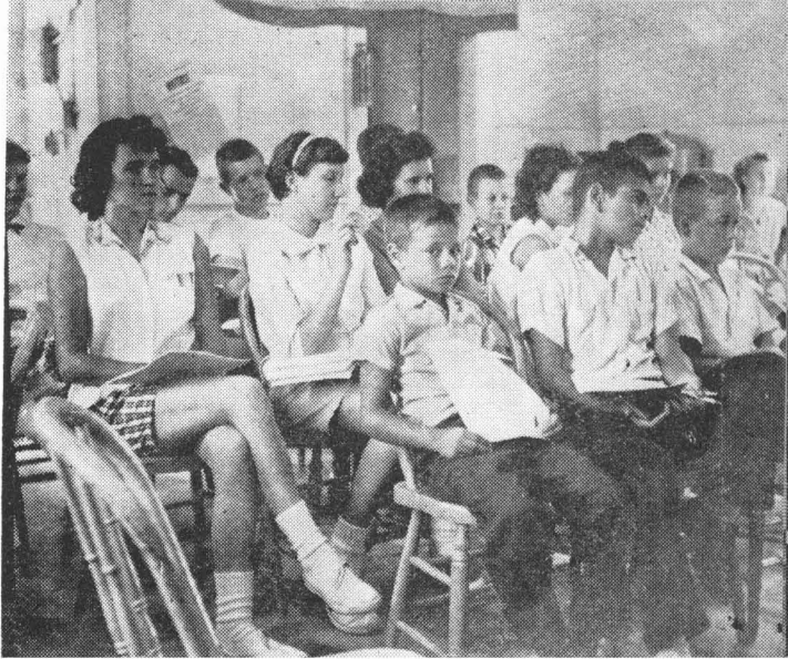
上は4-H 普及員から野菜の審査法を学ぶ野菜プロジェクトグループ。