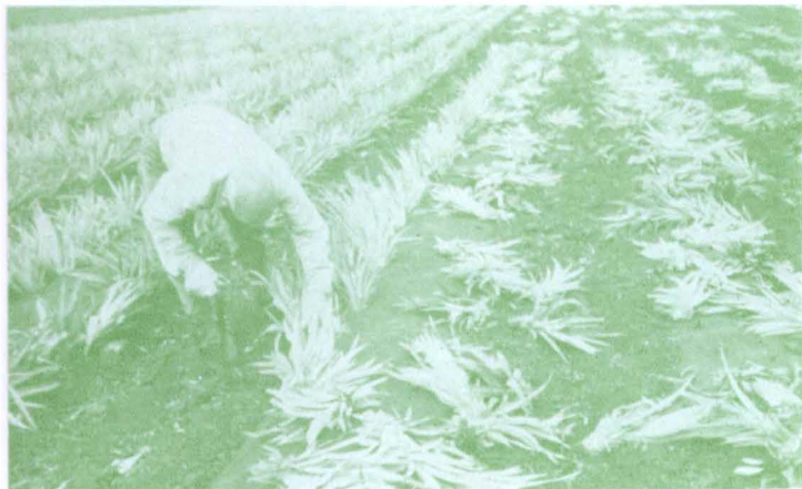
植付だけはまだ人の手で この人は1日20-25ドルもかせぐという