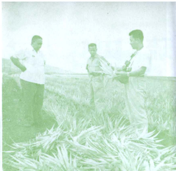
同一の圃場には同サイズの苗をそろえる クニアにて