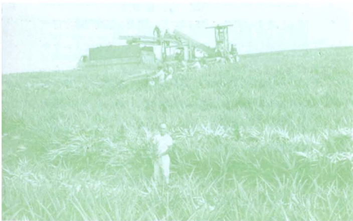
マウイ島でパインを栽培する郷土二世のフレッド玉代勢さんと そのパイン畑 現在約16万坪を耕作しているが 2年後には34 万坪に拡張すると意気こんでいる 一派会社並の近代農業機械 をもっているのには驚いた