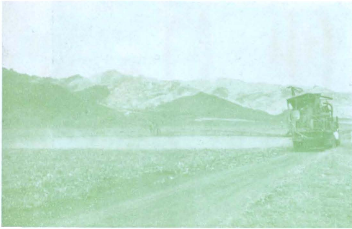
パイン畑の薬剤散布風景