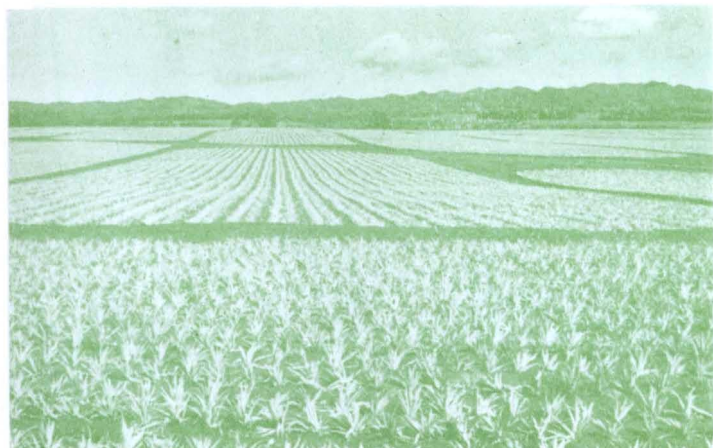
植付けをすんだばかりのパイン畑 株間だけペーパーでマルチ ワヒアワにて