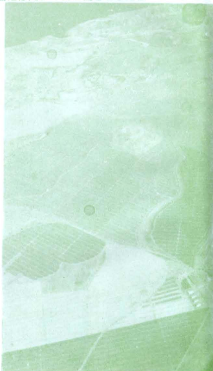
飛行機の窓から見たパイン畑 区画は網の目の如く整然と少しのムダもない モロカイ島にて