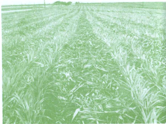
株間はペーパー 畦間は前作のパイン葉でマルチしたパイン畑 クニアにて