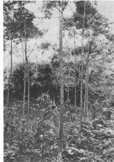
(1) 疏大与那演習林のセンダンとイヌマキの混交林 (2年生)

技術の進歩が非常に早い今日、自然まかせの造林は、いかにも時代遅れの感がありますが、大きな自然の力を軽視したり、これを簡単に人間の力で変えることができるなどと考えることは大変危険な考え方だと思います。自然の力と樹木の性質とを、近代科学の力で解明して正しく理解し、自然の力を巧みに利用して、健全な森林を仕立て、成長量の増加を図るということが、林業経営、森林育成上の根本的な考え方であればなりませんし、