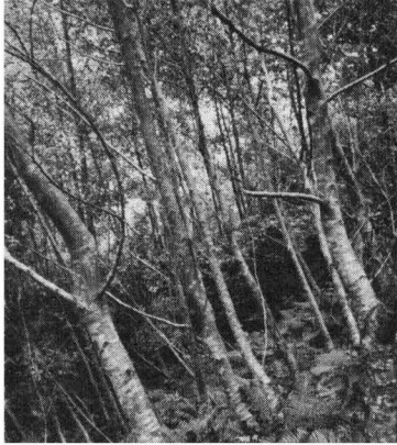
(2)を近くから写したもの

このようにして、木を植えようとする山の自然的条件をよく調べ、その上で何をどう植えるかを決めなければなりません。土壌や岩石の名前を1つ1つ知らなくてもまた土壌の成分や状態を分析までして調べなくても、細かく丁寧に観察することによって、かなり正しく山や土壌の状態を知ることができます。それだけで結構役に立ちます。