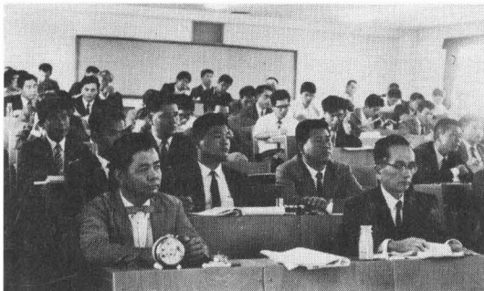
同研究発表会に参加した会員の皆様