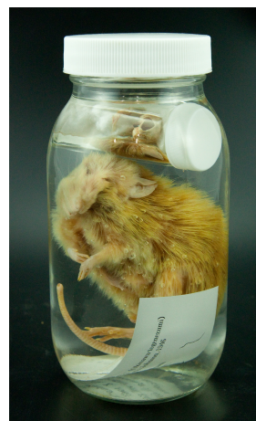
RUMF-ZZ-00049 オキナワトゲネズミ (液浸) Tokudaia muenninki (Johnson, 1946)