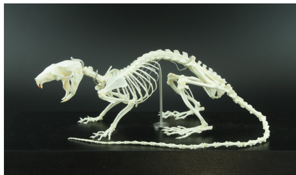
RUMF-ZZ-00116 ケナガネズミ (骨格) Diplothrix legata (Thomas, 1906)