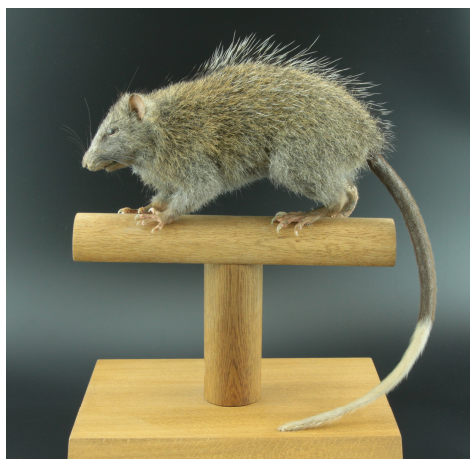
RUMF-ZZ-00115 ケナガネズミ (本剥製) Diplothrix legata (Thomas, 1906)