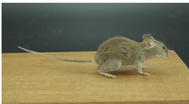
RUMF-ZZ-00058 オキナワハツカネズミ (本剥製) Mus caroli Bonhote, 1902