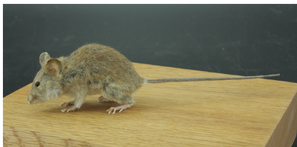
RUMF-ZZ-00057 オキナワハツカネズミ (本剥製) Mus caroli Bonhote, 1902