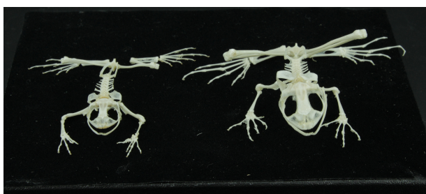
RUMF-ZH-00692、693 ハナサキガエル (骨格) Odorrana narina (Stejneger, 1901)