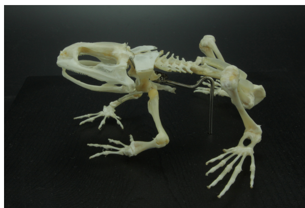
RUMF-ZH-00683 ナミエガエル (骨格) Limnonectes namiyei (Stejneger, 1901)