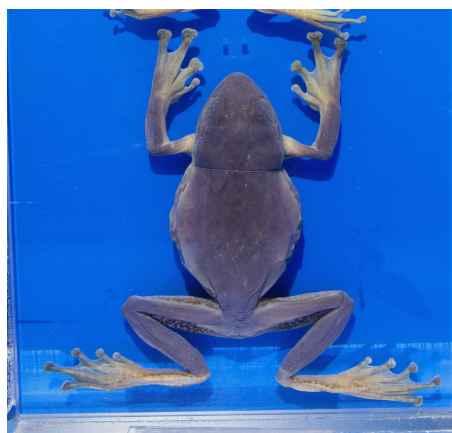
RUMF-ZH-00889 オキナワアオガエル (液浸) Rhacophorus viridis viridis (Hallowell, 1861)