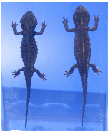
RUMF-ZH-00697、00876 イボイモリ (液浸) Echinotriton andersoni (Boulenger, 1892)