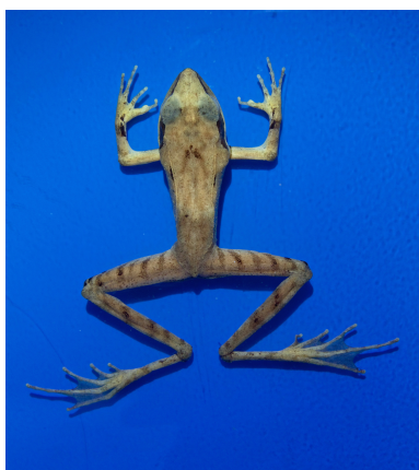
RUMF-ZH-00890 リュウキュウアカガエル (液浸) Rana sp.