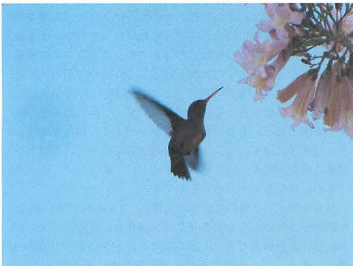
4. Picaflor Comun with Lapacho Rosado