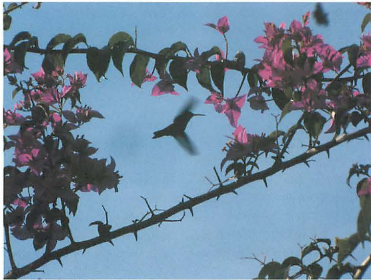
8. Picaflor Comun with Bougainvillea glabra