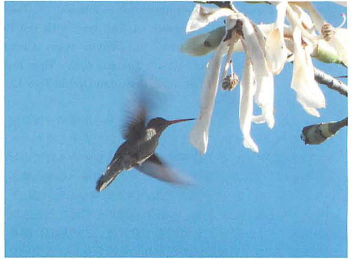
2. Picaflor Garganta Blanca with white flower of Ceiba chodattii