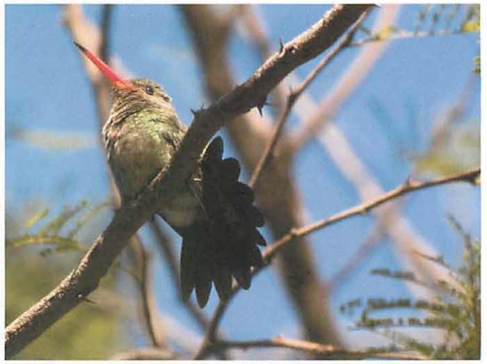
10. Picaflor Comun, perching on the branch of Algarrobo tree