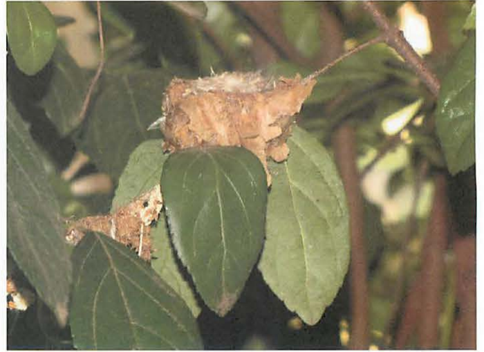
7. A nest of Picaflor Comun with 2 eggs inside