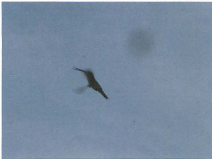
9. Hovering for flying insects, Picaflor Garganta Blanca