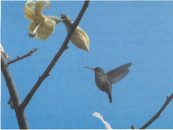
1. Picaflor Comun with yellow flower of Ceiba chodattii