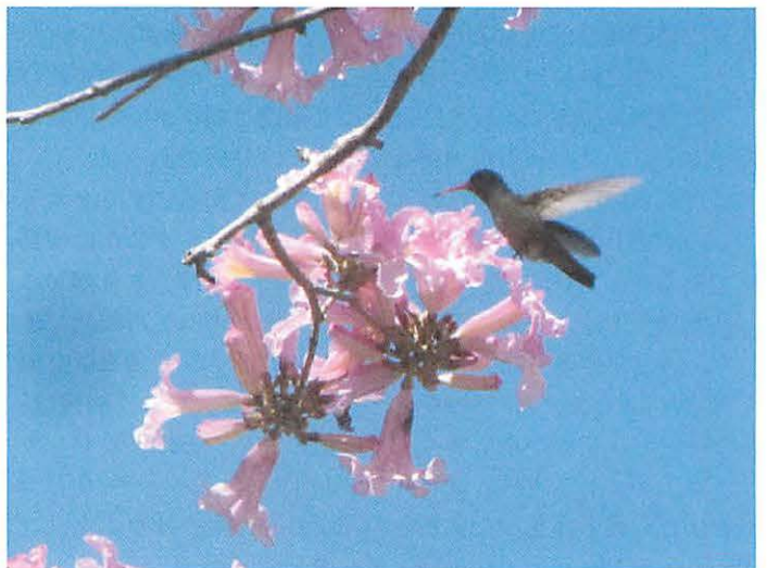
5. Picaflor Comun with Lapacho Rosado