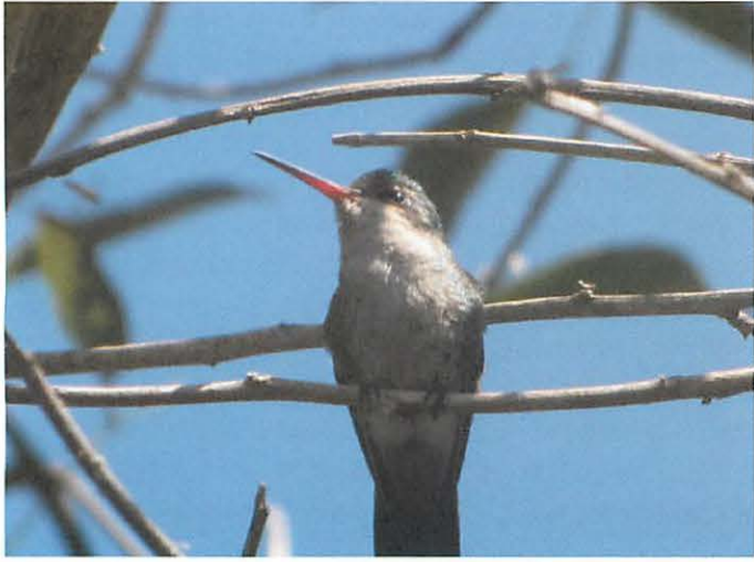
6. Mother bird of Picaflor Comun at the branch