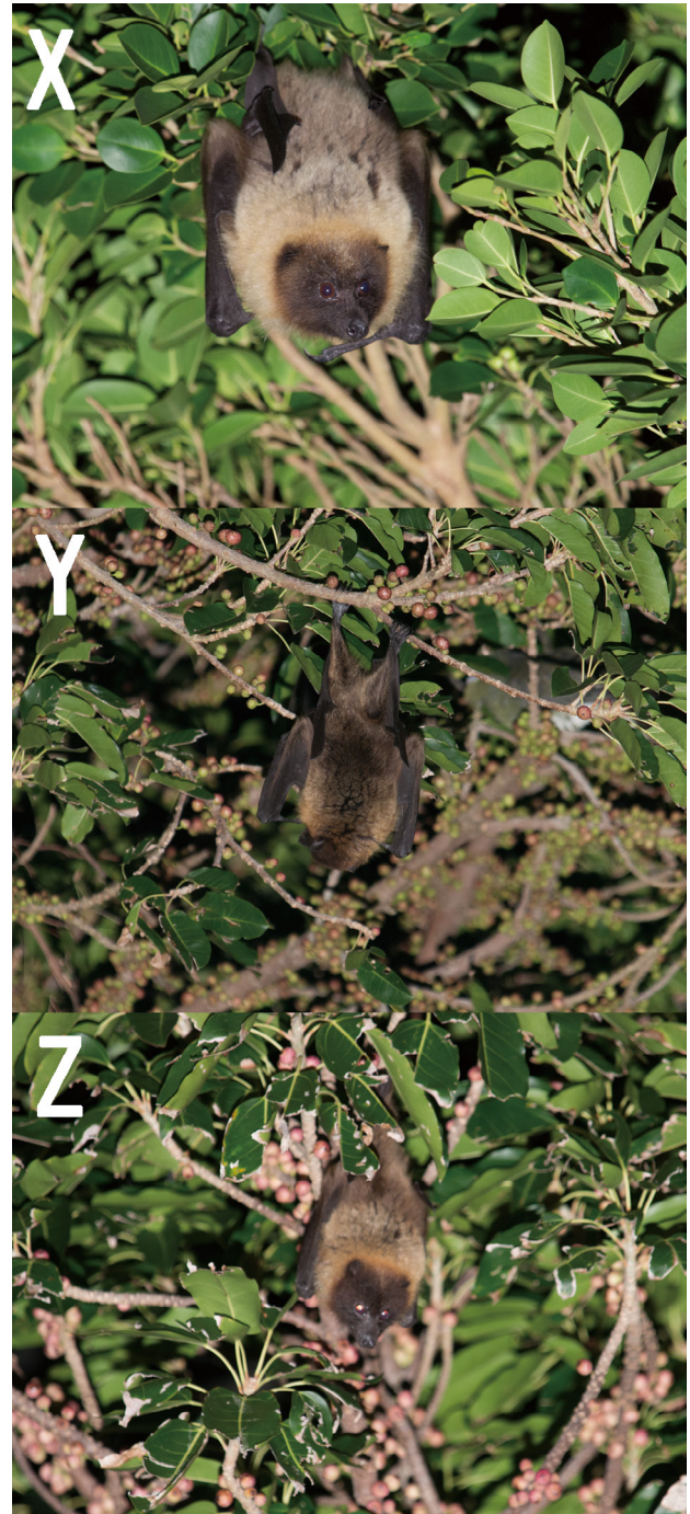
図 3. 観察されたクビワオオコウモリ. X, 休息中の個体 (E 地点, 2013.1.14 撮影); Y, アコウを採餌中の個体 (E 地点, 2013.1.14 撮影); Z, アコウを採餌中の個体 (F 地点, 2013.1.14 撮影).