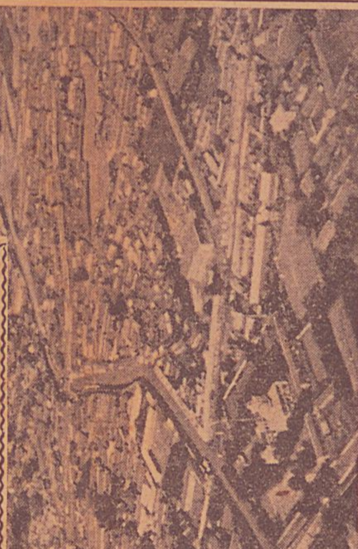
△新國都となる長春

この新國家は、東アジアの中心地として、重要な地位を占めることになる。その面積は約一、七〇〇、〇〇〇平方キロメートル、人口は約一、七〇〇万人である。この新國家は、東アジアの中心地として、重要な地位を占めることになる。