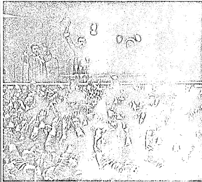
日本国万歳を三唱 壇上は唱和される両陛下

天皇陛下のお言葉は、国民の心を一つにし、皇位の尊厳を固く守る決意を表明された。退位説は終止符を打たれた。