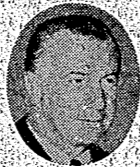
アグニュー 副大統領

政府はロジャー・大佐のほかに、アン・ニール副大統領の来日を米側へ要請しているが、外務省筋は米側から来日するか全く日本側へ連絡がないとしている。 政府は五月十五日にわたる沖繩復帰式典に、米政府首脳の出陣を要請していたが外務省筋は十七日、ロジャー・大佐と副大統領の来日はむずかしくなるとを察めた。これは前長官が五月二十二日から、そのニール副大統領の訪日同行するが、その確も多いためである。 政府はロジャー・大佐のほかに、アン・ニール副大統領の来日を米側へ要請しているが、外務省筋は米側から来日するか全く日本側へ連絡がないとしている。