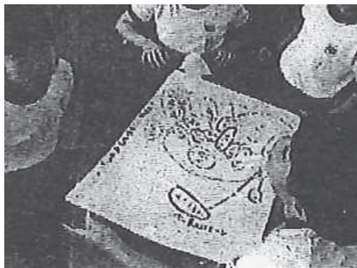
図 1：2 年生が大豆について連想して概念マップを作っている様子 (16)

以上の二つの方法は児童の文章力や国語力に影響される部分が多いのに対し、「視覚的描写法」 (15) は低学年の児童にも使いやすいパフォーマンス評価の方法である。例えば、概念マップ法の利用として、総合学習の単元の始まりに中心的なテーマをめぐってどのような学習活動ができるか、あるいは、自分で選んだ素材についてどのような工程が必要なのかを連想し、ブレンストーミングすることができる（図 1 を参照）。