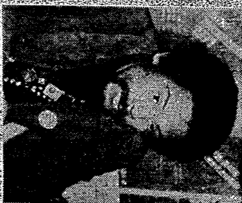
横田清三少将(右)は、米軍の核兵器を運ぶ航空機に搭乗した。背景には、核兵器を運ぶB-29超長距離爆撃機が飛行している。