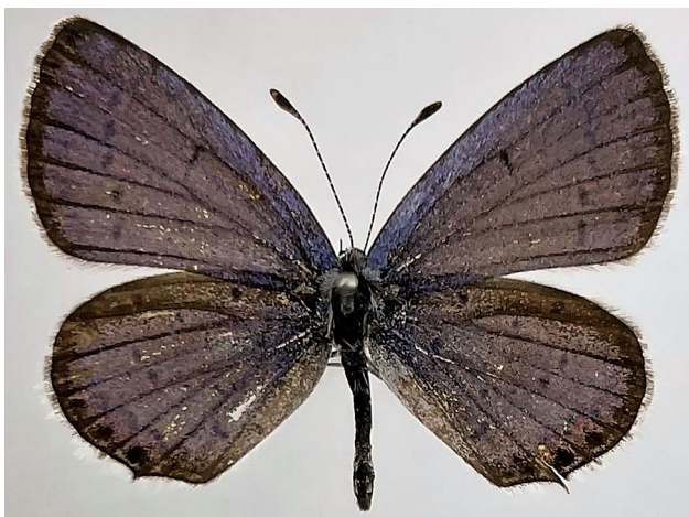
図 1. 西表島産ツバメシジミ (♂) の標本.

備考. 西表島では 1986 年 (北原 1987) と 2006 年 (西田 2007) に記録がある. 本報告は, 西表島において 3 例目の記録になる. これらの記録が, どの方面からの偶産か要調査である.