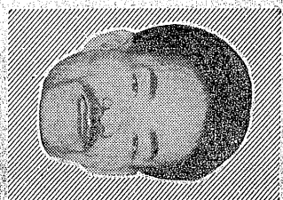
追放された那覇市長