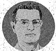
ムラオカ高等弁務官