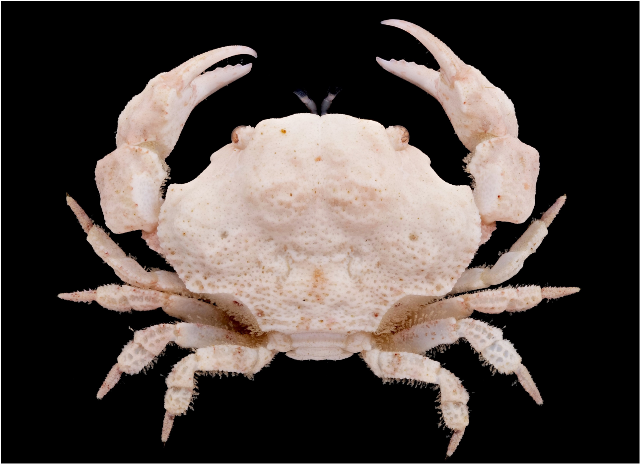
図 1. マルミホラガニ (新称), 生時の色彩, 背面全体 (RUMF-ZC-7503, 雄, 7.3×10.8 mm). 辛島なつ氏撮影. Fig. 1. Hepatoporus pumex Mendoza & Ng, 2008, living colouration, entire animal, dorsal view (RUMF-ZC-7503, male, 7.3×10.8 mm). Photo taken by N. Karashima.

おいては先端の一部が僅かに甲の外側に露出するのみである。腕節は長節より短い肥大し、球形に近い。長節、腕節の表面は隆起や癒合した顆粒によって粗面を呈する。腕節内面上部の先端部 1/3 と掌部上面の基部 1/2 は平滑で浅く凹み、鉗脚の屈曲時に下肝域の窪みと合わせて空洞を形成する (図 2A)。掌部の外面および上面は隆起や顆粒、小孔によって粗面であり、外面には明瞭な 3 条の縦走隆起が見られる。指節は掌部よりやや短く、可動指、不動指ともに細く、やや下垂する。可動指の外面および上面には 4 条の顆粒列からなる隆起が縦走し、不動指の外面には 2 条の顆粒列からなる隆起が縦走する。両咬合縁には幅広い三角形の歯が 4-6 個並ぶ。