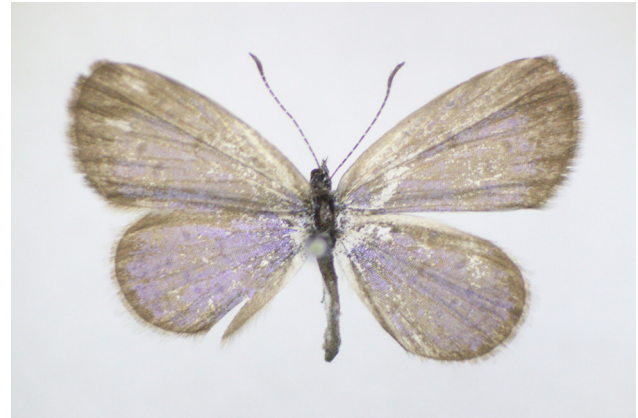
図 1. 1988年に宮古島で採集されたホリイコシジミ (♂).

新田敦子・新田智, 2001. 離島大好き採集ガイド 沖縄・宮古編. 蝶研出版, 茨木. 東清二・金城政勝・木村正明, 2002. チョウ目 (鱗翅目). 増補改訂 琉球列島産昆虫目録. Pp. 397-465. 沖縄生物学会, 西原.